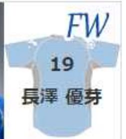
スフィーダ世田谷FCの選手が配るポスター